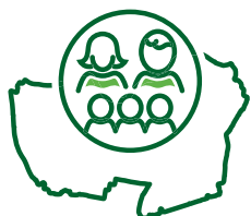
Zorg, Jeugd en Participatie