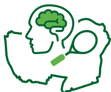
Onderwijs, Sport en Cultuur