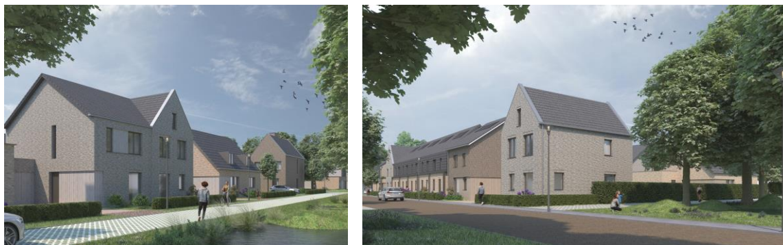
Afbeeldingen zijn indicatief en kunnen geen rechten aan ontleend worden

Bij interesse in een projectwoning kunt u zich nu alvast inschrijven via www.debovendonken.nl