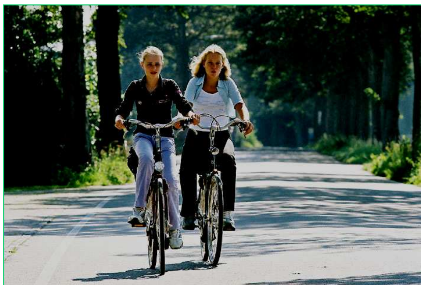
Standaardbuitensedijk Oud Gastel. Brugklassers onderweg naar huis.